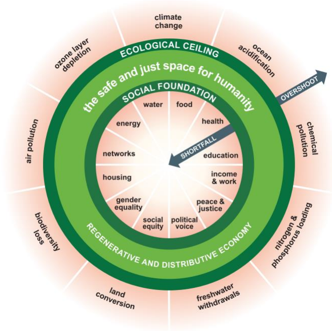
MYND 1: KLEINHRINGURINN.